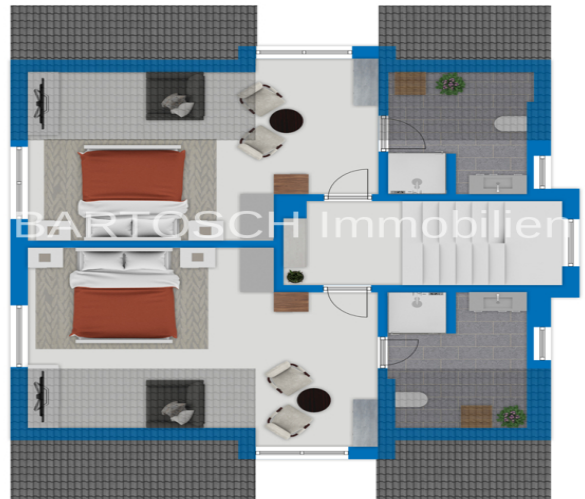
Exposeplan, nicht maßstäblich