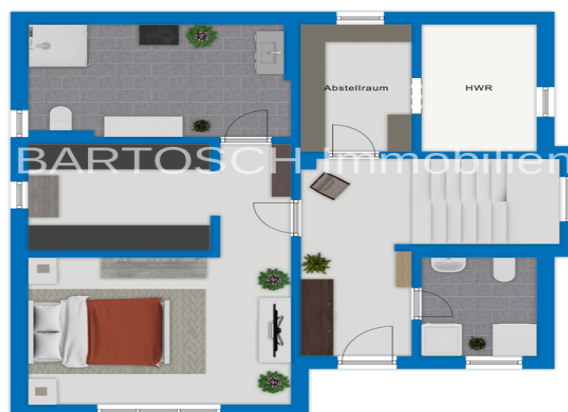
Exposeplan, nicht maßstäblich