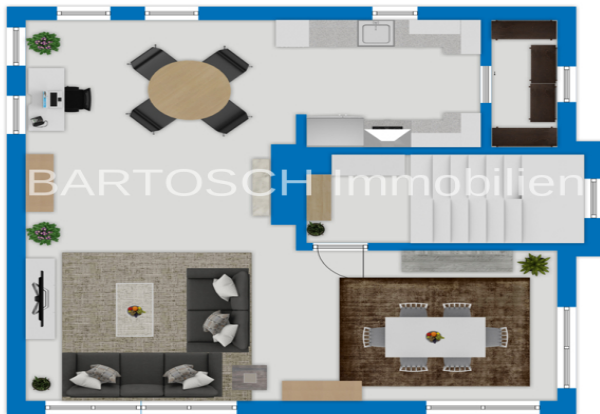
Exposeplan, nicht maßstäblich